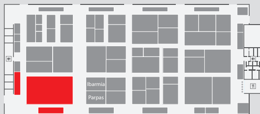
Halle 9 Stand 9A11